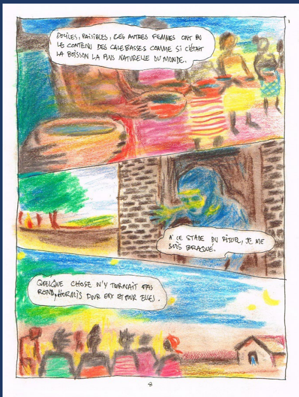
Visuel : © Nimrod et Adjim Danngar, Extrait du storyboard Le maçon et l'argile © Éditions Le Manteau et la Lyre © Maison de la poésie des Hauts-de-France, 2024

Visite en résonnance avec l'exposition Patrimoine en mouvement – Construire un avenir durable.